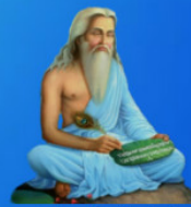
గురు వాశుకి మహర్షి