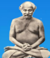
గురు లాహిరి మహాశయ