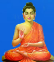
గురు గౌతమి బుద్ధి