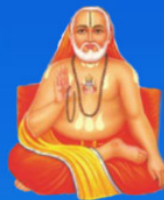
గురు రాఘవేంద్ర స్వామి