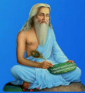
గురు వాల్మీకి మహర్షి