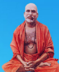
గురు మహయాళ స్వామి