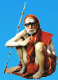
గురు చంద్రశేఖర పరమాచార్య